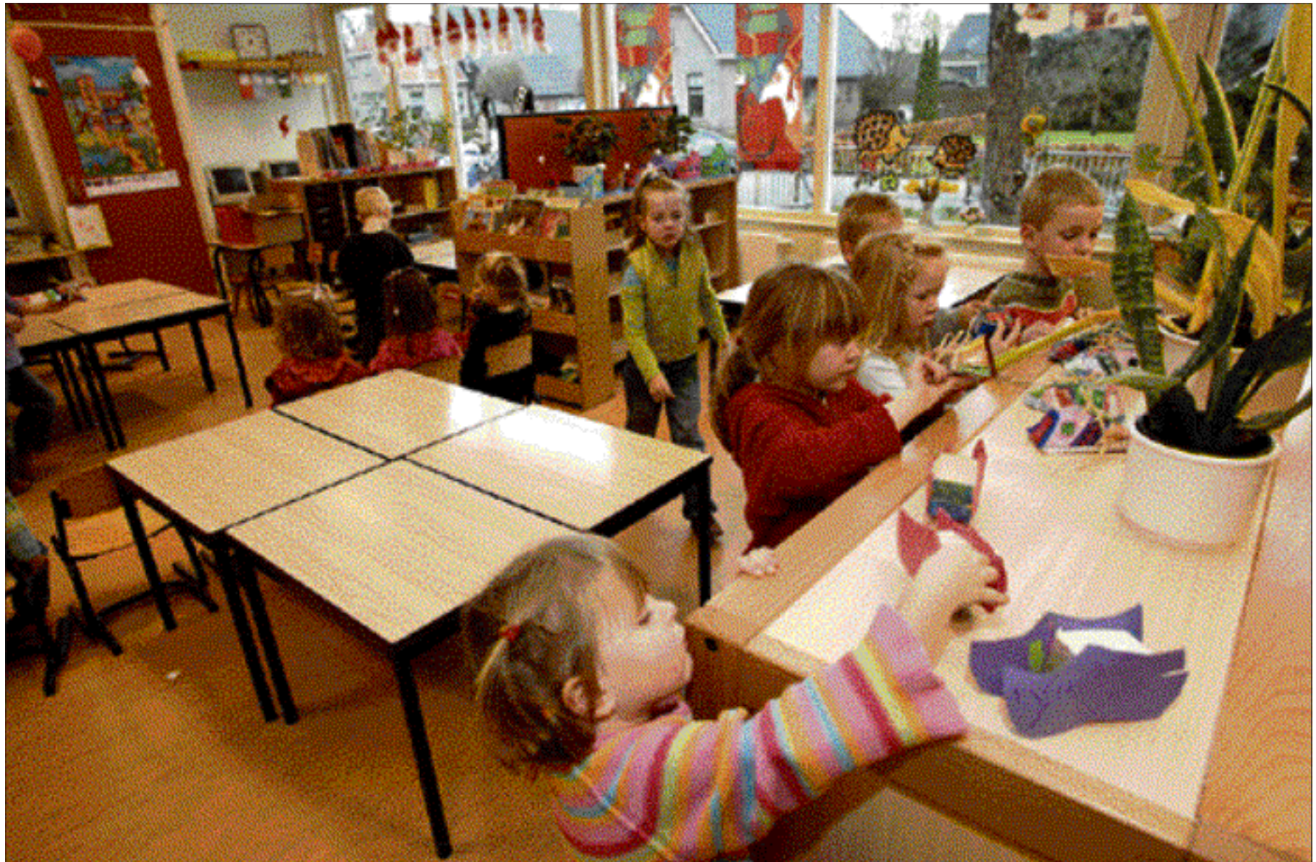
Speelse kinderen in De Hoekstee in Vledder. Zij ademen meer frisse lucht in dan de meeste andere kinderen in Nederland.